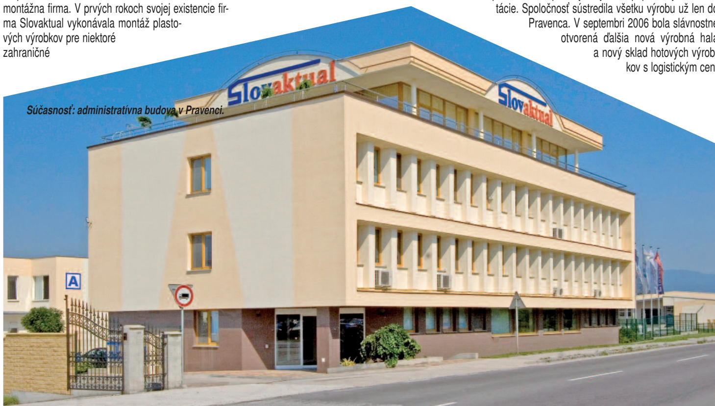
Súčasnosť: administratívna budova v Pravenci.

V roku 2005 – k pätnástemu výročiu pôsobenia spoločnosti na trhu – bola dostavaná ďalšia výrobná hala v tom čase s najmodernejšou technológiou riadenou počítačmi bez potreby akejkoľvek papierovej dokumentácie. Spoločnosť sústredila všetku výrobu už len do Pravencia. V septembri 2006 bola slávnostne otvorená ďalšia nová výrobná hala a nový sklad hotových výrobkov s logistickým cen-