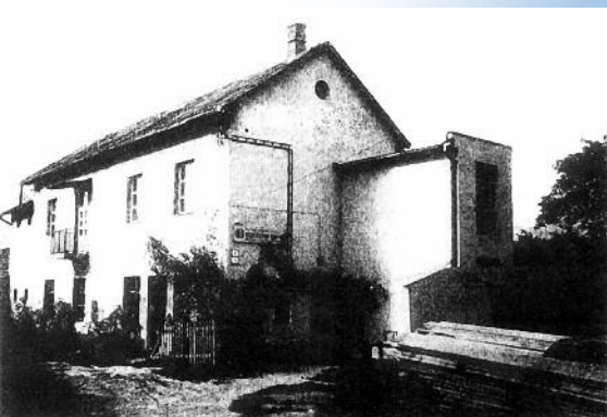
Prvá výrobná hala Nitrianske Pravno.