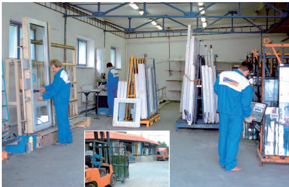
Zasklievanie okien - prevádzka Nitrianske Pravno - rok 2000.

Spoločnosť Slovaktual, ktorá dosiahla najvyššiu priečku kvality a stala sa jednotkou na trhu najväčších výrobcov, má aj naďalej smelé plány. Už teraz sa myslí na budúcnosť a pripravujú sa investície do výstavby nových výrobných hál a moderných technológií. Aby si udržala svoje miesto v porovnaní s konkurenciou a zabezpečila zamestnanie svojim pracovníkom, je nutné sa prispôbovať náročným požiadavkám spotrebiteľa. Jej cieľom nie je „nejako prežiť ďalšie desaťročie“, ale úspešne dobíjať svetové trhy najkvalitnejšími výrobkami.