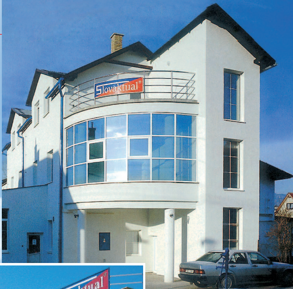
Novopostavená výrobná hala v Nitrianskom Pravne – rok 2001.