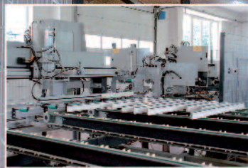
Výrobná hala Nitrianske Pravno - nárezové a obrábacie centrum, rok 2001.

re odobratá kinetická energia, a tak netlačí na ďalšie dve tesniace roviny tvorené prítlačným gumeným profilom.