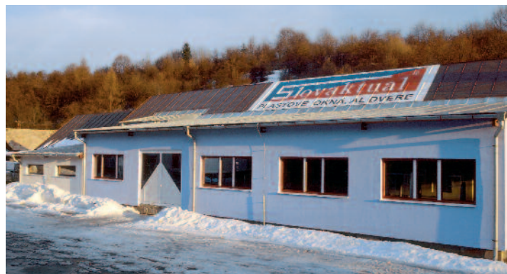
Zrekonštruovaná výrobná hala Vyšehradné.