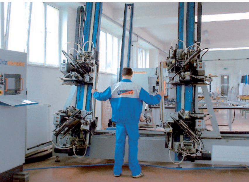
Nitrianske Pravno - kovacia linka 2001.