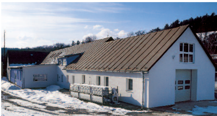
Výrobná hala Vyšehradné.

Priestor v rámovej časti okna a krídla (funkčná škára) je rozdelený pevnou priehradkou (nos) do dvoch komôr. Vonkajšia (vlhká) komora slúži na odvádzanie vlhkosti a vody (kondenzátu) odvodňovacími drážkami na vonkajší parapet. Vnútorňa (suchá) komora chráni kovanie voči vlhkosti a nečistotám, čím predlžuje jeho životnosť. Vetrom hanej dažďovej vode je v prednej vlhkej komo-